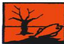
Periculos pentru mediu

Pentru deseurile infectioase care nu sunt taietoare-intepatoare se folosesc cutii din carton prevazute in interior cu saci din polietilena sau saci din polietilena galbeni ori marcati cu galben. Atat cutiile prevazute in interior cu saci din polietilena, cat si sacii sunt marcati cu pictograma "Pericol biologic".